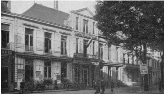
De Pascentrale op de Kouter