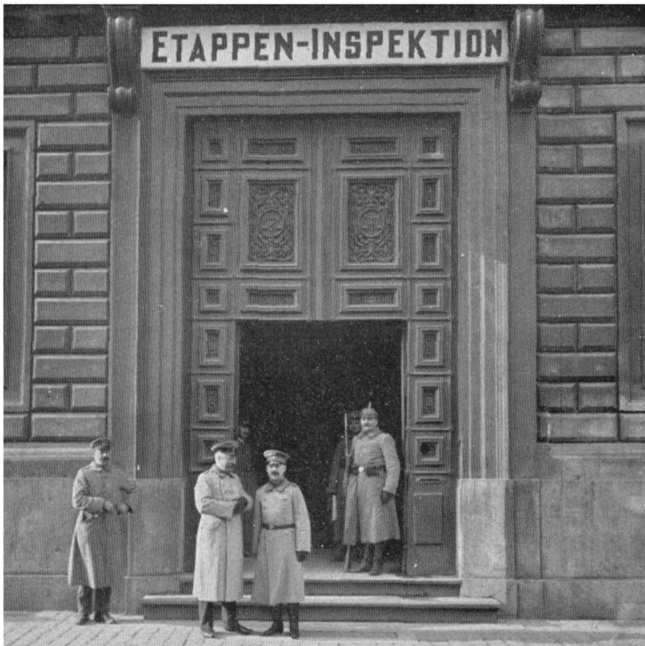
De etappeninspectie in het Justitiepaleis