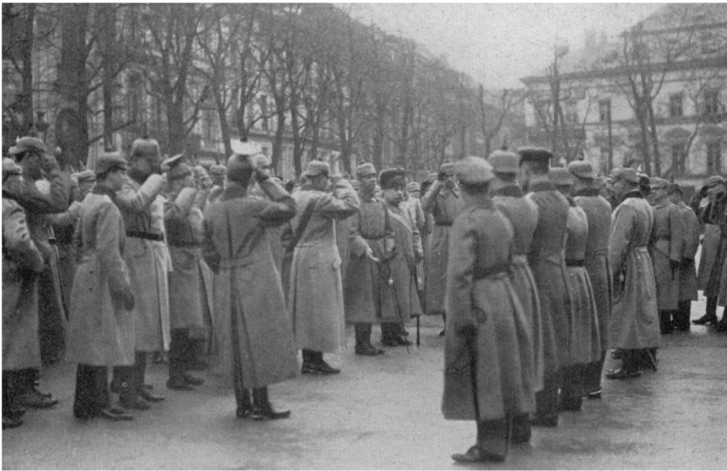
Duitse parade op de Kouter